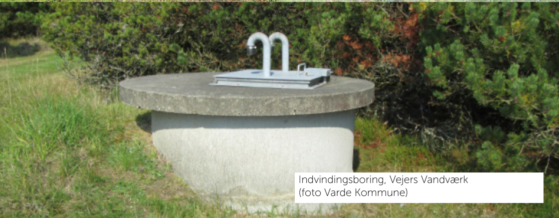
Indvindingsboring, Vejers Vandværk