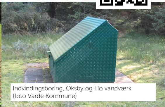
Indvindingsboring, Oksby og Ho vandværk