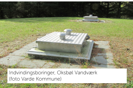
Indvindingsboringer, Oksbøl Vandværk